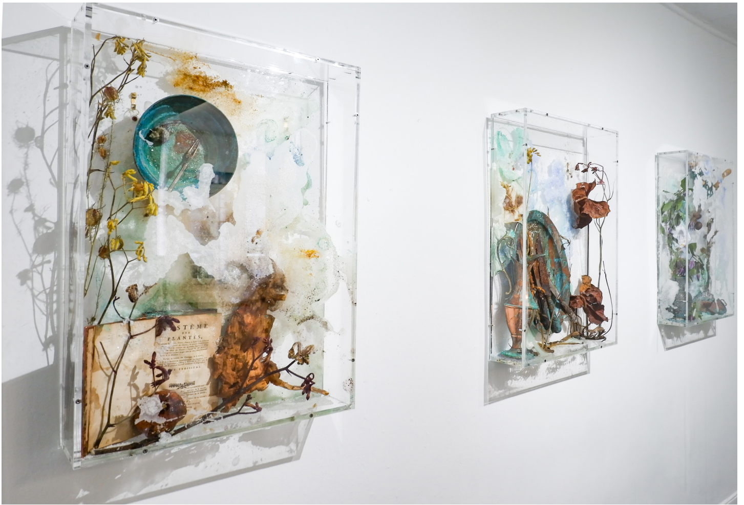
Bloom series, exposition Diet & Psychology , 2018. Courtesy of the artist ©Bianca Bondi ADAGP.