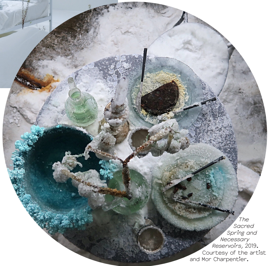
The Sacred Spring and Necessary Reservoirs , 2019. Courtesy of the artist and Mor Charpentier.