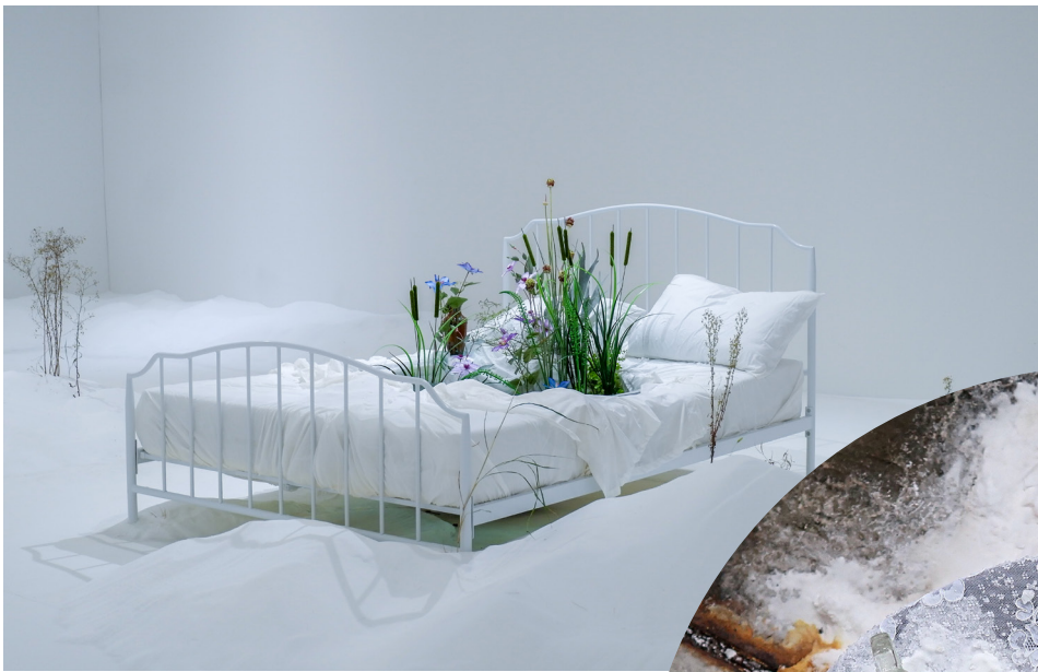
The Antechamber (Tundra Swan) , 2020. Busan, KR.