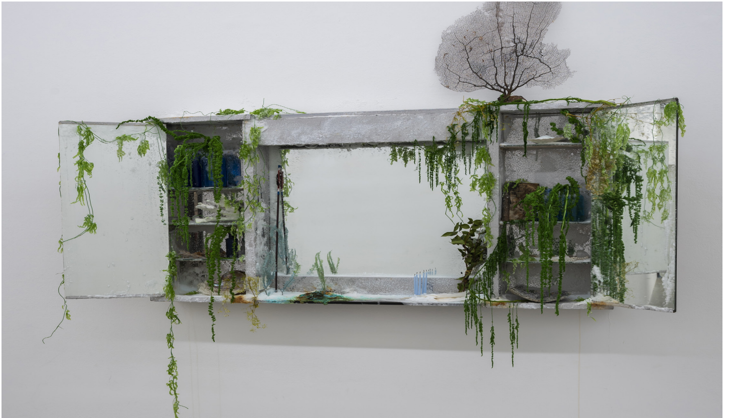
Instable trésor, temple simple à Aphrodite , 2022. © Cyril Boixel. Courtesy of the artist and Mor Charpentier.