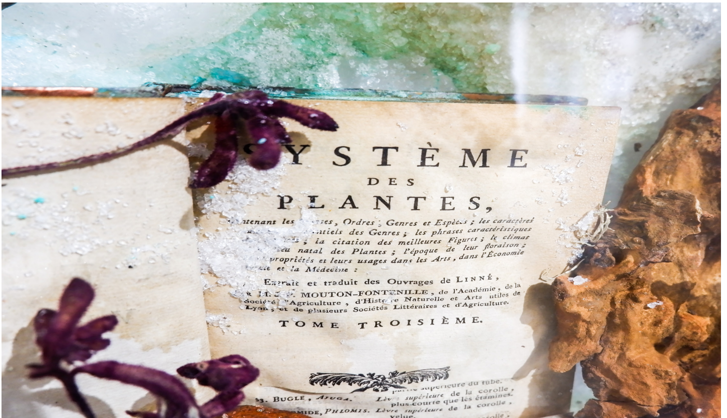
Bloom series, exposition Diet & Psychology , 2018. Courtesy of the artist ©Bianca Bondi ADAGP.