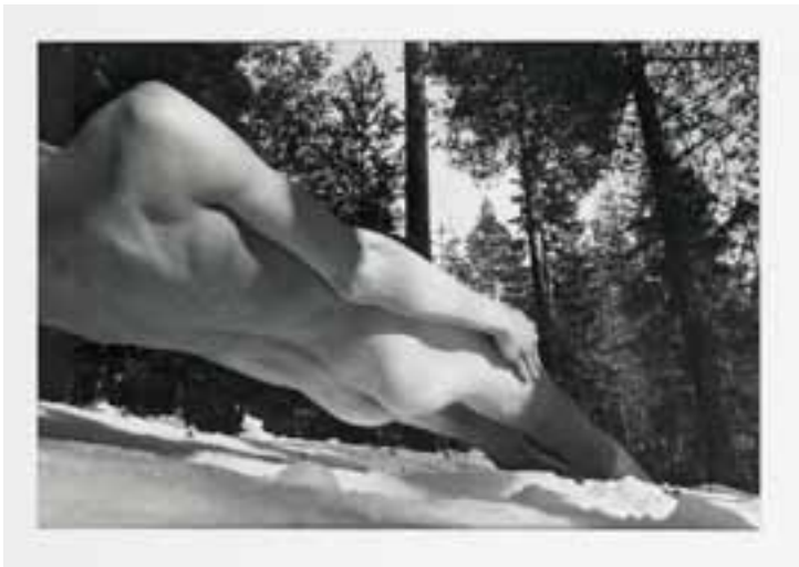
Arno Rafael Minkinen, Berne, Suisse , 1975 Collection FRAC Champagne-Ardenne © Arno Rafael Minkinen