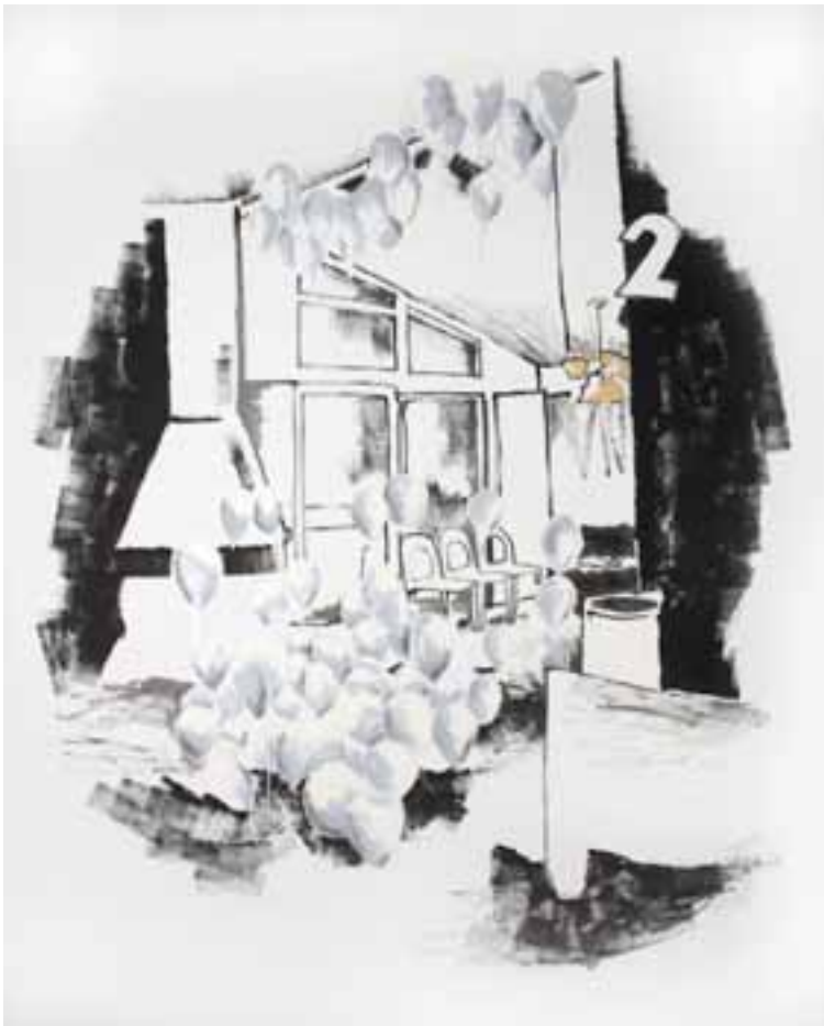
Sylvie Auvray, LA Balloon , 2008 Collection FRAC Champagne-Ardenne