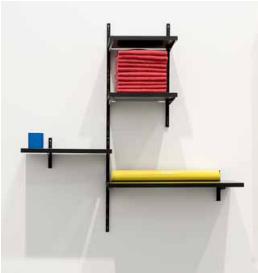
Mathieu Mercier, Drum n' Bass Lafayette , 2005 Collection FRAC Champagne-Ardenne © Adagp, Paris