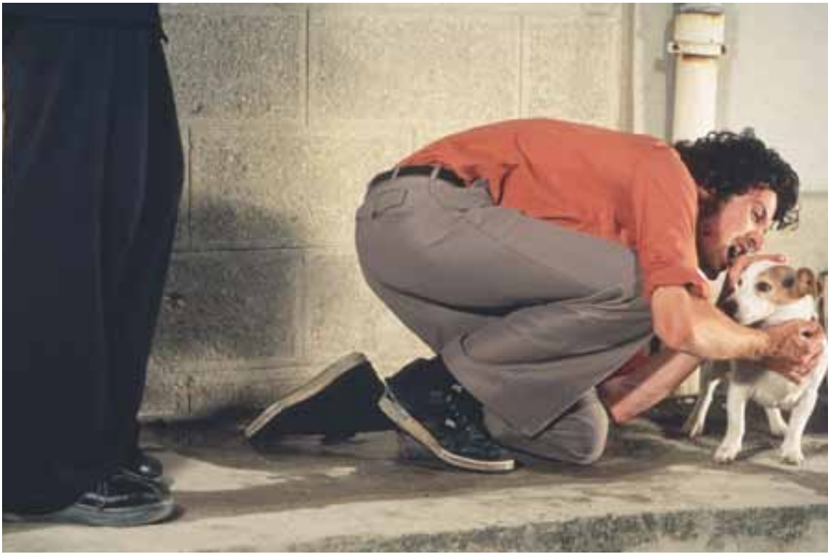
Laurent Montaron, La Voix de son maître , 1999 Collection FRAC Champagne-Ardenne