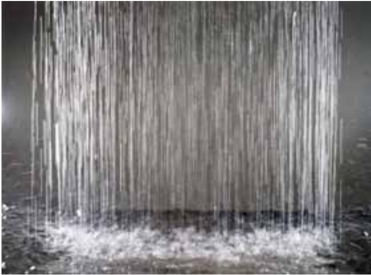
Patrick Tosani, Pluie , 1986 Collection FRAC Champagne-Ardenne © Adagp, Paris