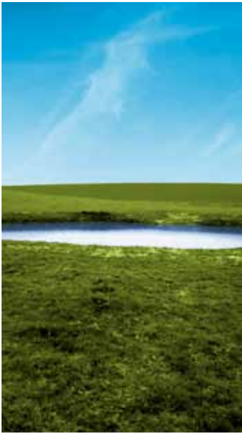
Brice Dupont, P 006 , impression photographique sur dibond, 2017. Courtesy de l'artiste