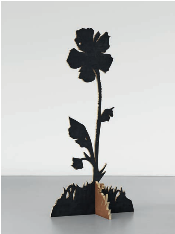
Tursic & Mille, BF1 , 2019 Bois coupé brûlé 227.5 x 109 x 84 cm