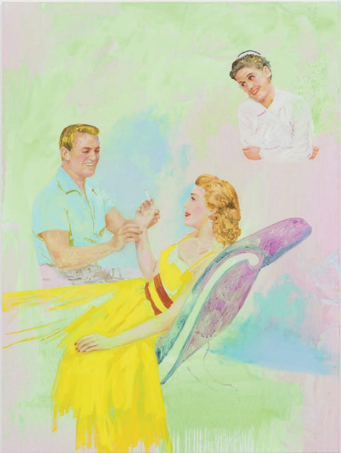
Tursic & Mille, It's better when it's good , 2019 Huile sur toile 200.3 x 150.1 cm Courtesy des artistes et Galerie Max Hetzler Berlin | Paris | London © Tursic & Mille, Photo: def image