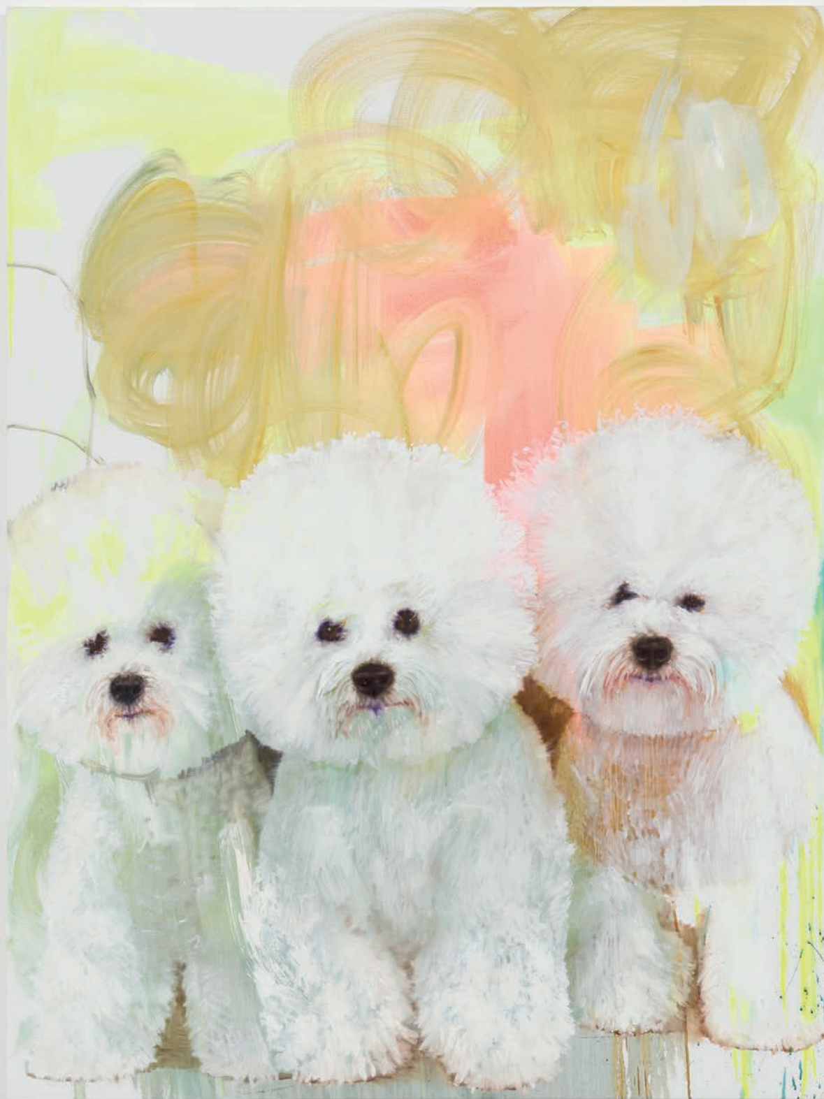
Tursic & Mille, This is the beginning of a beautiful friendship , 2020 Huile sur toile 200.3 x 150.1 cm Courtesy des artistes et Galerie Max Hetzler Berlin | Paris | London © Tursic & Mille, Photo: def image