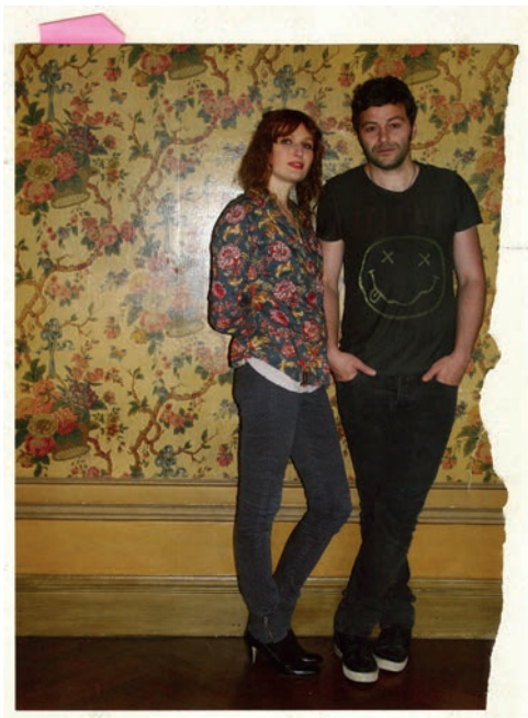
© Ida Tursic & Wilfried Mille Courtesy des artistes