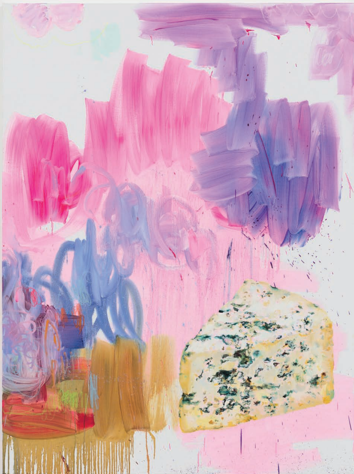
Tursic & Mille, Abstract painting with Roquefort , 2020 Huile sur toile 200.3 x 150.1 cm