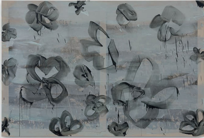
Tursic & Mille, Black flowers , 2018 Huile et argent sur toile 200 x 300 x 5 cm