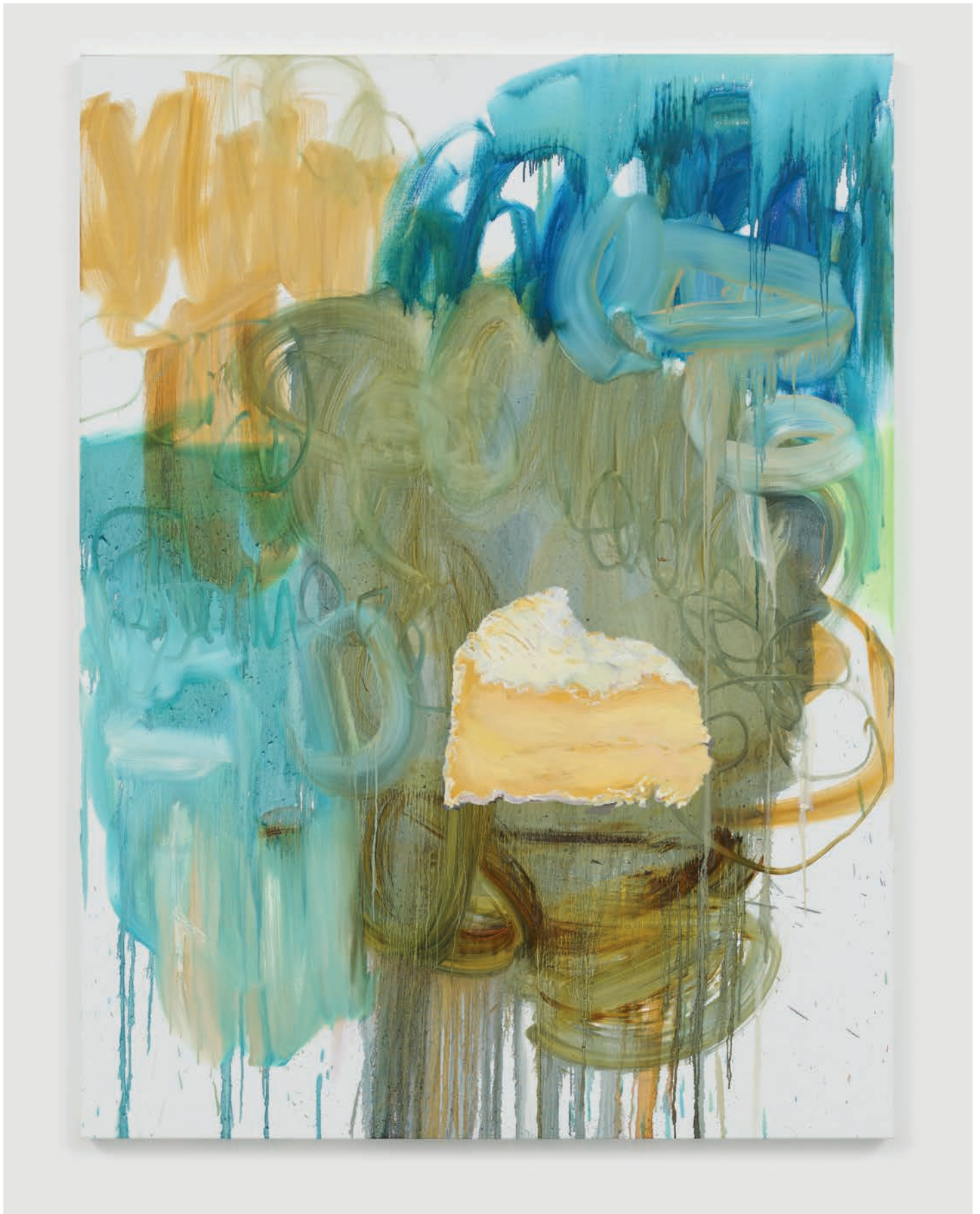
Tursic & Mille, Abstract painting with Camembert , 2020 Huile sur toile 200.3 x 150.1 cm Courtesy des artistes et Galerie Max Hetzler Berlin | Paris | London © Tursic & Mille, Photo: def image