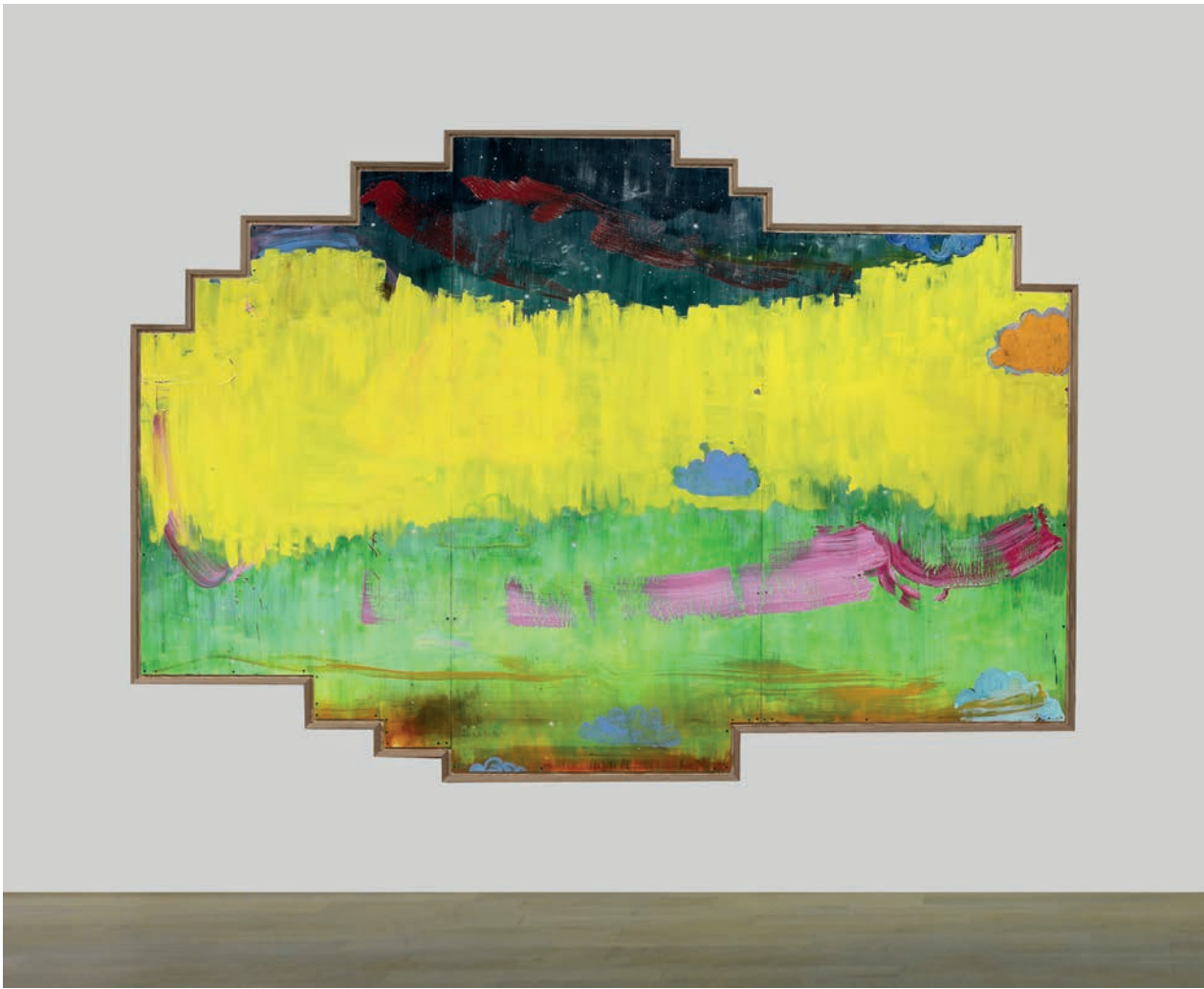
Tursic & Mille, Starry sky with yellow and clouds , 2020 Huile sur panneaux de bois coupés, cadre en chêne 258 x 374 x 5 cm Courtesy des artistes & Alfonso Artiaco, Napoli