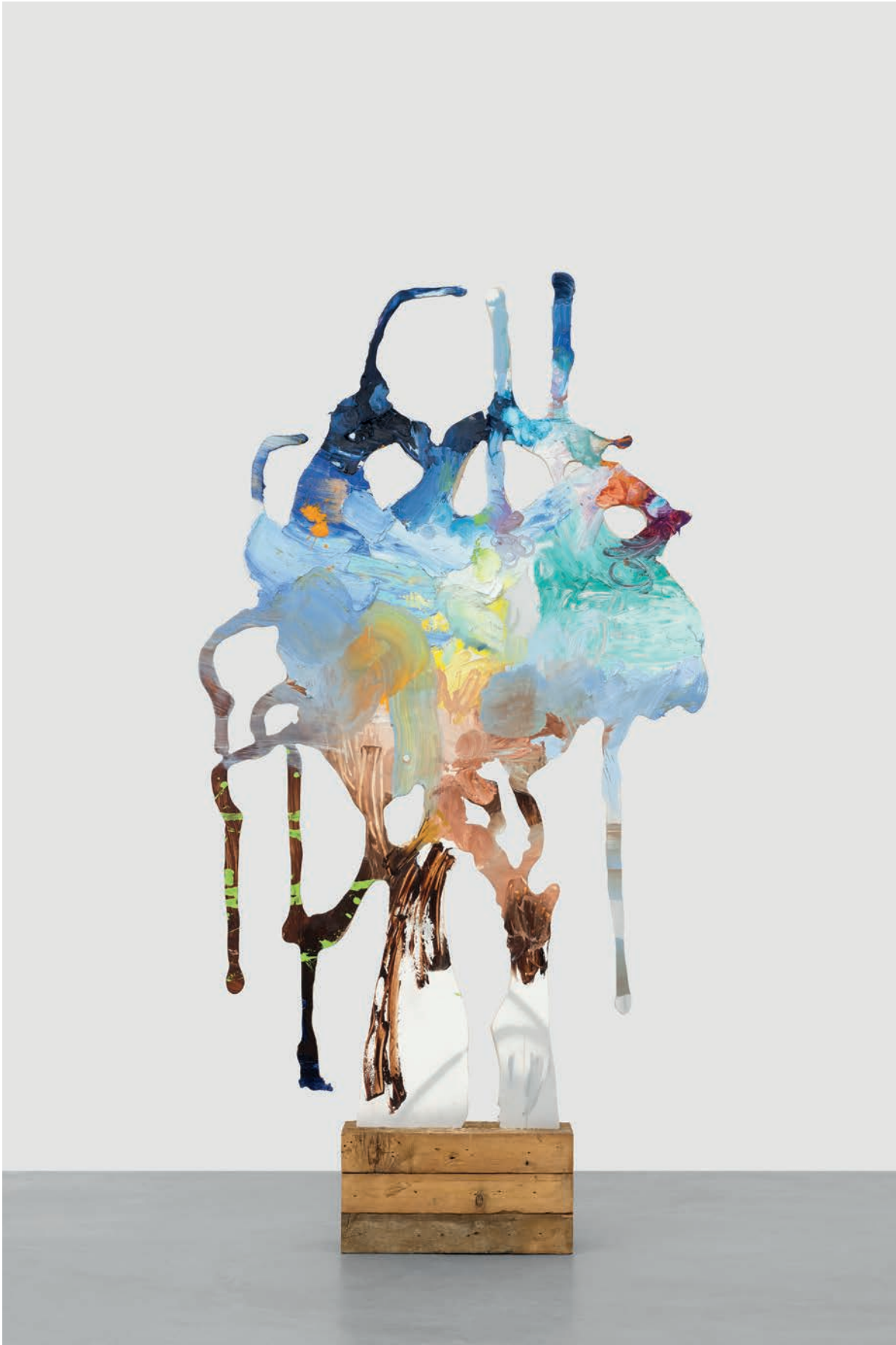
Tursic & Mille, Blue smear , 2018 Huile sur bois 215 x 123 x 3 cm