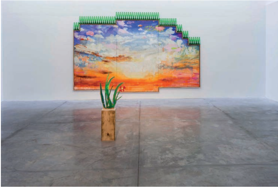
Tursic & Mille, Melancholic Sunset , 2018 Peinture : Huile sur bois, 64 bouteilles de bière, 214 x 372 cm Fleur : Huile sur bois de Douglas, 105 x 42 x 18,5 cm Courtesy des artistes & Alfonso Artiaco, Napoli